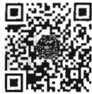
กระทู้ถามสด ด้วยวาจา